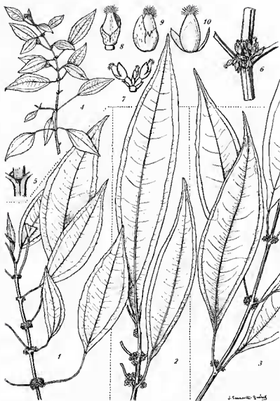
Pl. 2. — Pilea macropoda : 1, rameau avec inflorescence ♀, \times 2/3 . — P. bemaioensis : 2, sommet de plante ♂; 3, sommet de rameau ♀, \times 2/3 . — P. Humbertii : 4, sommet de plante ♀, \times 2/3 ; 5, détail d'un nœud, fortement grossi; 6, inflorescence \times 4 ; 7, trois fleurs ♀ \times 8 ; 8, 9, fleur ♀ \times 15 ; 10, ovaire et graine vue par transparence.